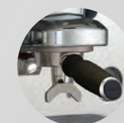
Portafiltro PRESTIGE+ Portafilter PRESTIGE+

Both versions are equipped with Faema adjustable thermal system. Only PRESTIGE+ has external knobs on the cupwarmer to be more functional and easy to access.