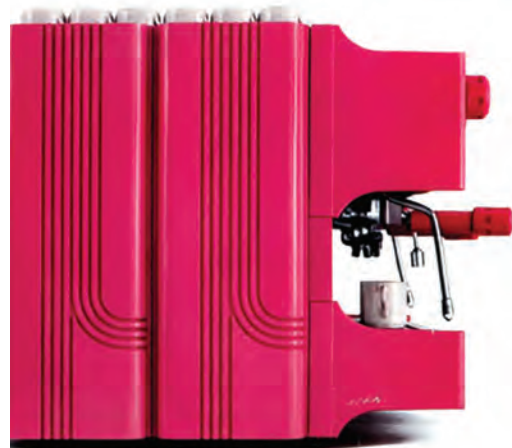
Prestige '70. Vista laterale dal design distintivo. Prestige '70. Side view with a distinctive design.