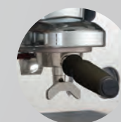
Portafiltro PRESTIGE Portafilter PRESTIGE